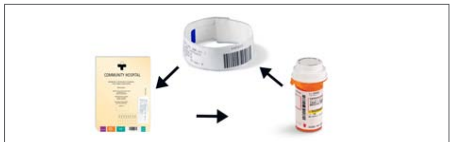
Der „Perfect Match“